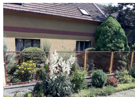
3. místo Jitka Culková získává poukázku do Růžové zahrady ve výši čtvrtiny platby za odpad