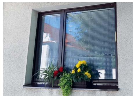
3. místo Petra Vetešnicková získává poukázku do Růžové zahrady ve výši čtvrtiny platby za odpad