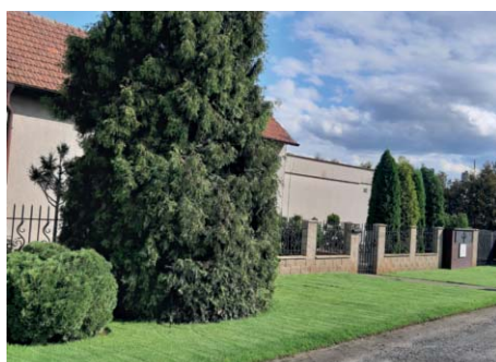
2. místo Miroslav Svoboda získává poukázku do Růžové zahrady ve výši půlroční platby za odpad