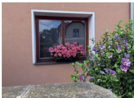
2. místo Šárka Majerechová získává poukázku do Růžové zahrady ve výši půlroční platby za odpad