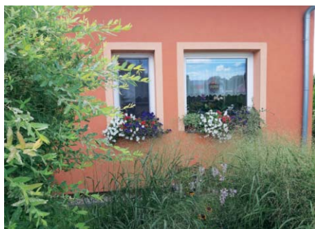
1. místo Jaroslava Horáková získává poukázku do Růžové zahrady ve výši celoroční platby za odpad