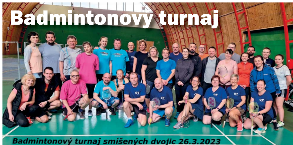
Badmintonový turnaj smíšených dvojic 26.3.2023

Dvakrát do roka se naši borci zúčastňují turnaje smíšených dvojic v Kralupech, který pořádá ASPV Veltrusy spolu s ASPV Libiš. Na podzimním turnaji brali naši bronz, na velikonočním, velmi kvalitně obsazeném, turnaji skončili naši nejlepší těsně pod stupni vítězů, druhý pár na sedmém místě z 16 dvojic.