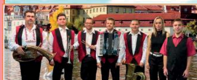
Plechovanka (malá dechová kapela ze severních Čech)