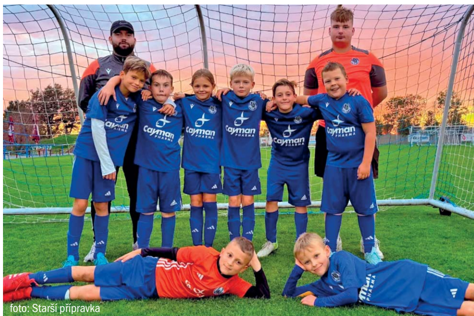
foto: Starší přípravka